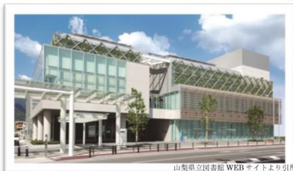
山梨県立図書館 WEB サイトより引用